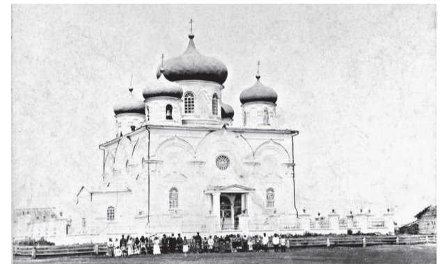
Снимок храма из фондов Курганского областного краеведческого музея, 1895 год